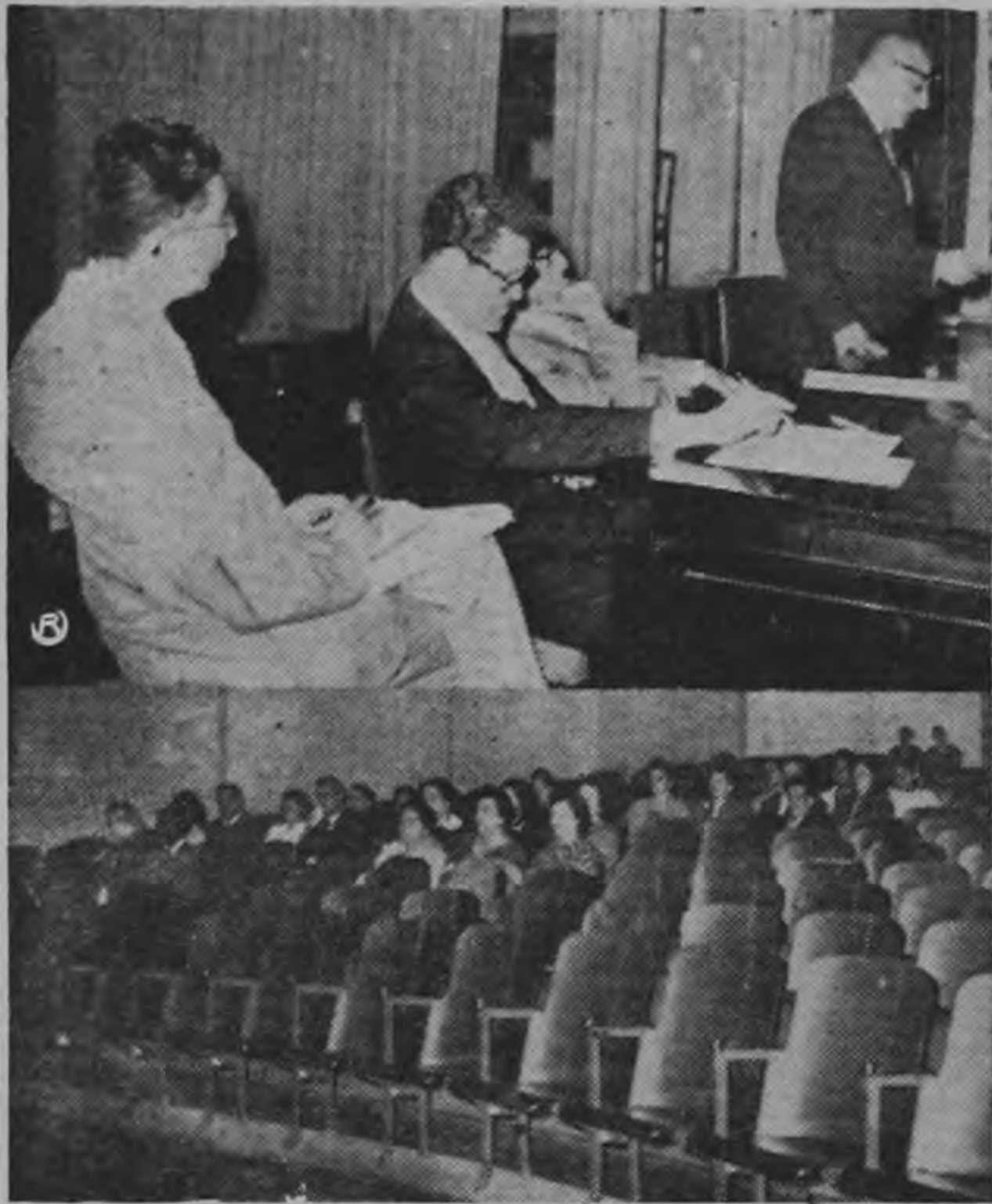
Hoy termina el Seminario sobre Educación Sexual que empezó el lunes pasado. La gráfica de Meza registra dos aspectos de la sesión inaugural. El evento se desarrolla a partir de las