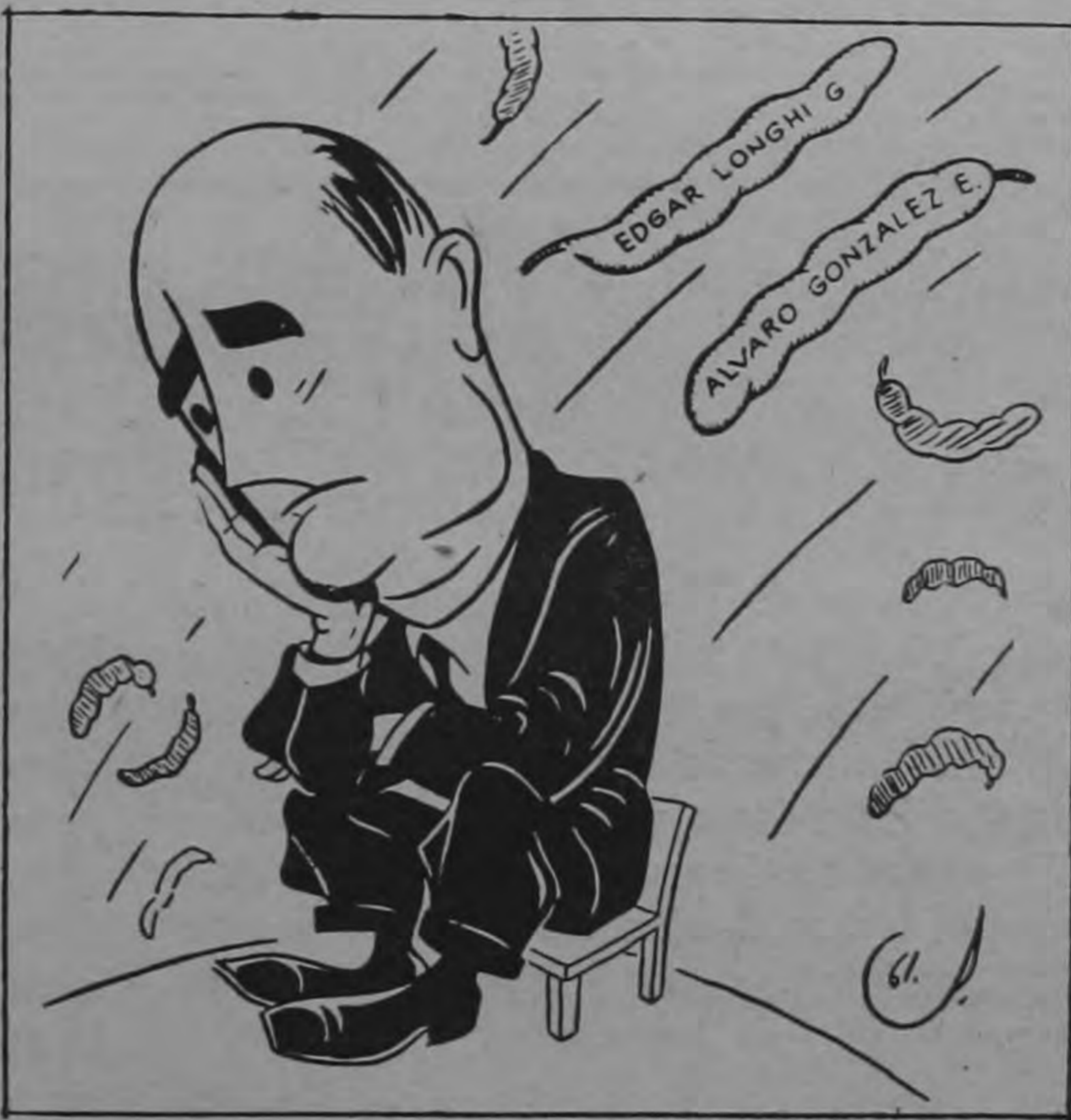
del Cielo llueven las vainas...!