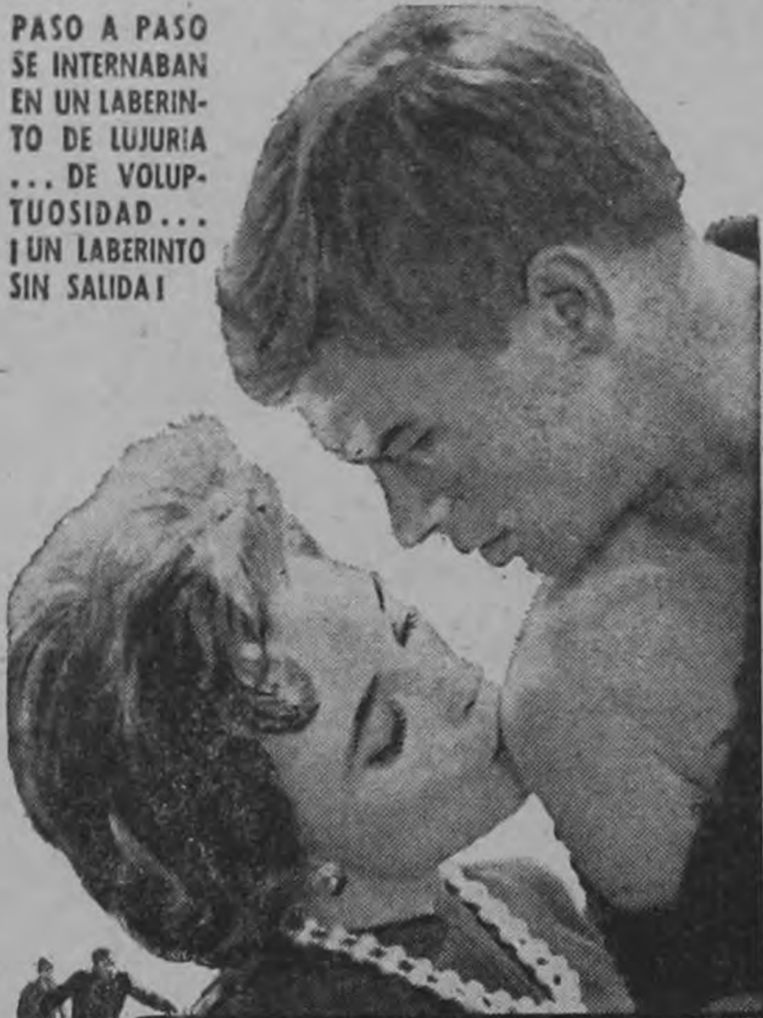
Una Película Diferente... Una Historia Cuyo Final Nunca Podrá Ser Adivinado!

PASO A PASO SE INTERNABAN EN UN LABERINTO DE LUJURIA... DE VOLUPTUOSIDAD... ¡UN LABERINTO SIN SALIDA!